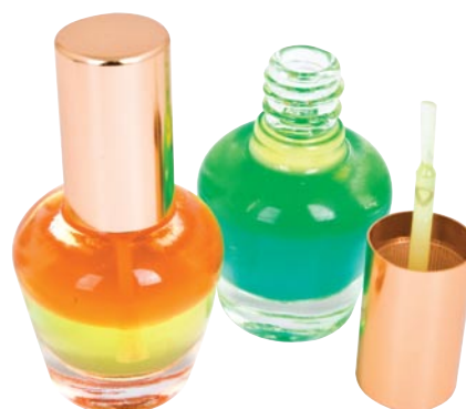
2 w 1