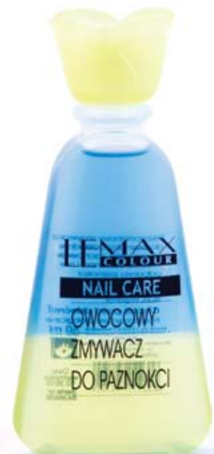
2 W 1